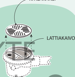
Kuva 4. Lattiakaivo, jossa ei ole irrotettavaa hajulukkoa.

NOSTETTAVA / AUKI KIERRETTÄVÄ RITILÄKANSI