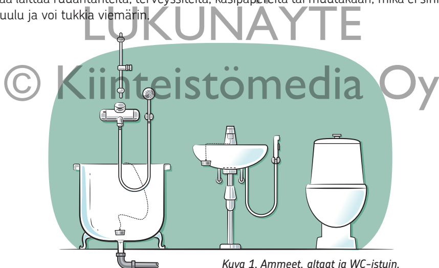
Kuva 1. Ammeet, altaat ja WC-istuin.

WC-istuinta saa käyttää vain sen käyttötarkoituksen mukaisesti. WC-istuimen päällä ei esimerkiksi saa seistä. WC-istuin ei myöskään ole roska-astia; sinne ei saa laittaa ruuantähteitä, terveysiteitä, käsipapereita tai muutakaan, mikä ei sinne kuulu ja voi tukkia viemäriin.