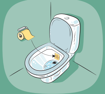
Kuva 2. Jos WC-paperi kostuu pöntön reunalla, WC-istuimen vesisäiliö vuotaa.

Voit testata helposti WC-paperin avulla, vuotaako WC:n vesisäiliö. Aseta paperinpala istuimen sisälle takaseinään. Jos paperi pysyy paikallaan, säiliö ei vuoda. Jos paperi sen sijaan kastuu ja valuu alaspäin, se on merkki säiliön vuotamisesta.